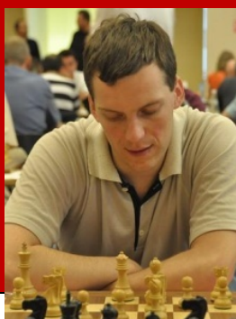
1. IM Rafal Antoniewski (POL)