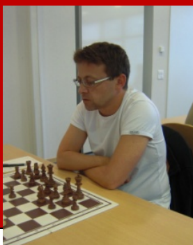
1. GM Boris Chatalbashev (BUL)